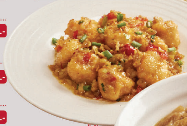
26 STIR-FRIED SHRIMP BALLS WITH CHILIES AND GARLIC