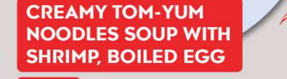
9 CREAMY TOM-YUM NOODLES SOUP WITH SHRIMP, BOILED EGG 115.-