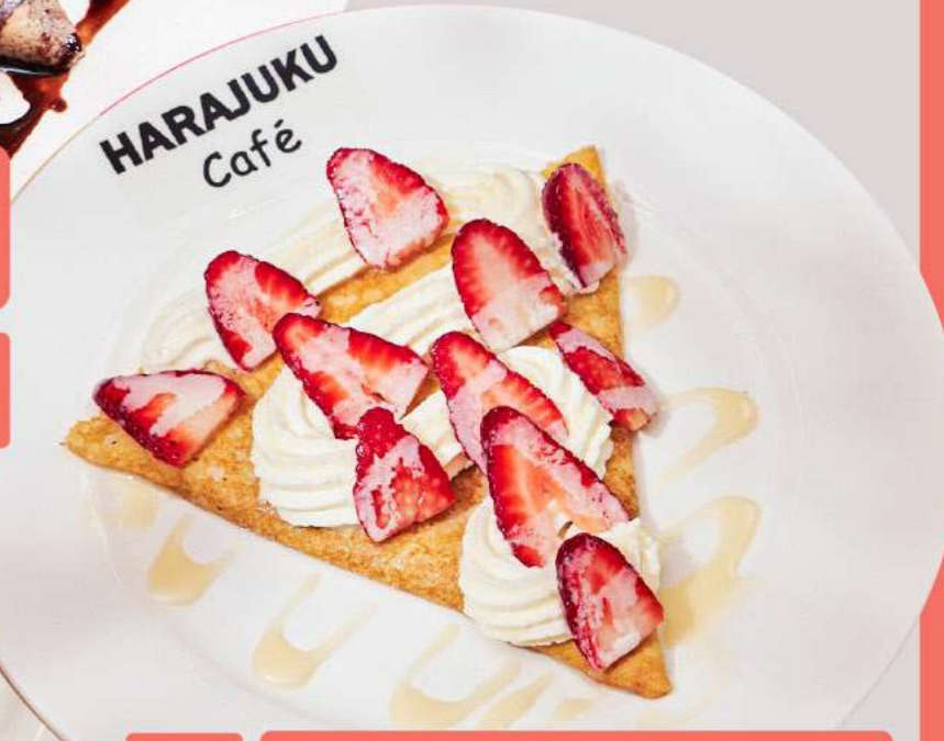
4 CREPE STRAWBERRY LOVER