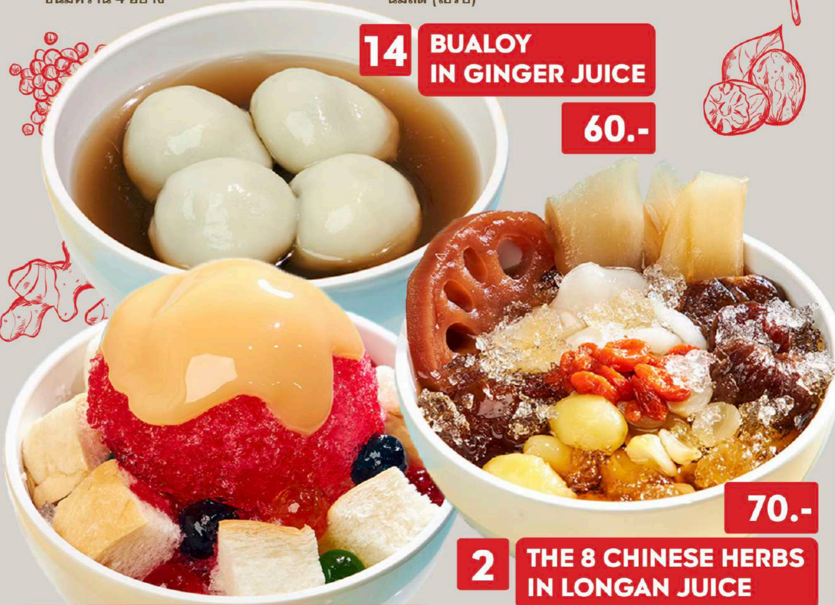
14 BUALOY IN GINGER JUICE 60.-