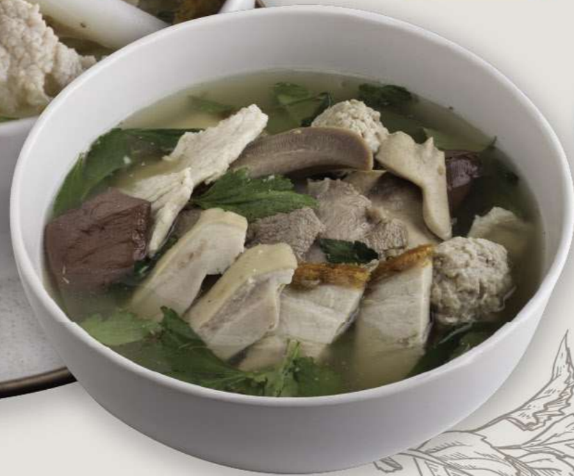
2 PORK ENTRAILS SOUP 85/105.-