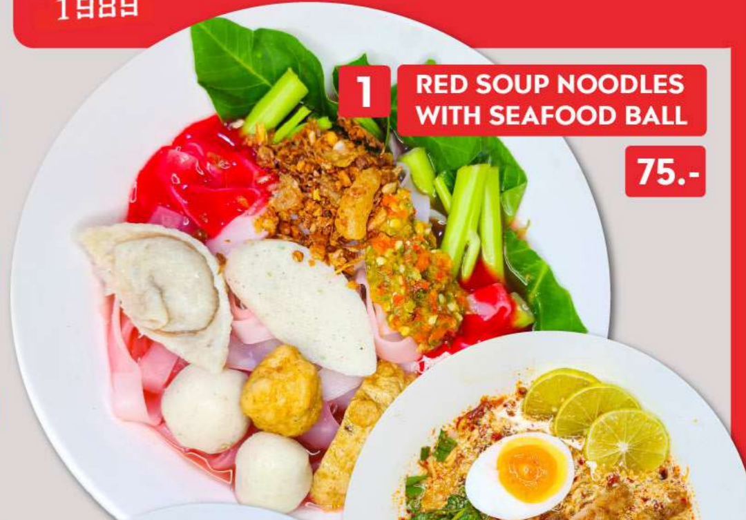
1 RED SOUP NOODLES WITH SEAFOOD BALL 75.-