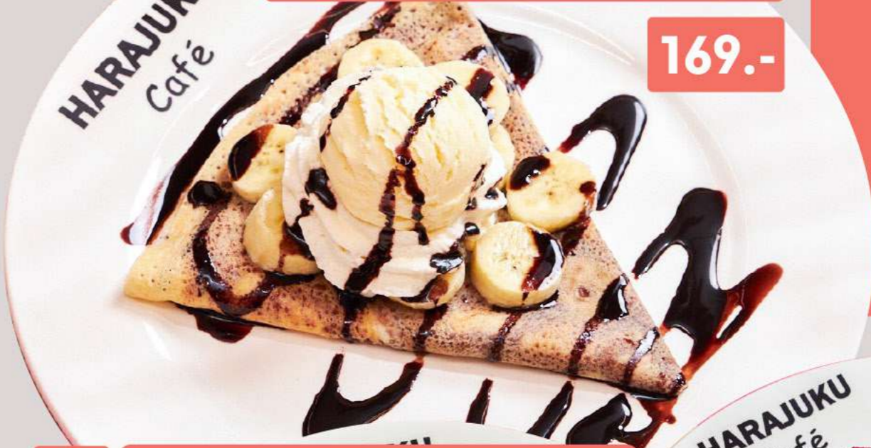
7 CREPE VANILLA ICE CREAM & BANANA & NUTELLA & WHIPPED CREAM