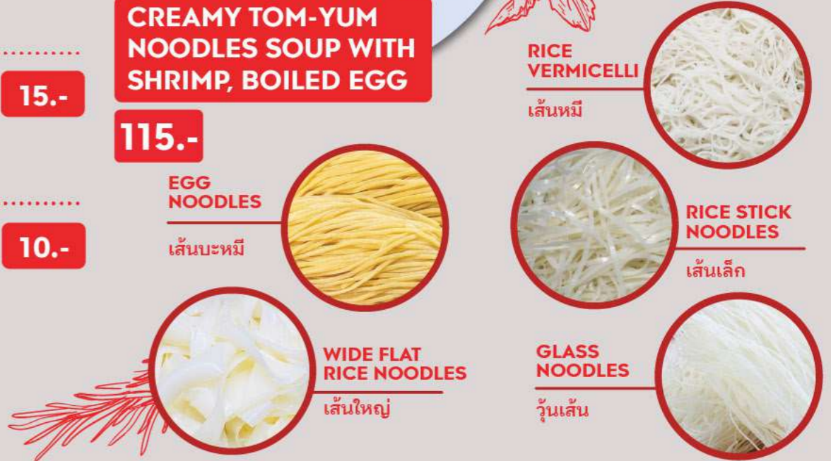
RICE VERMICELLI เส้นหมี่