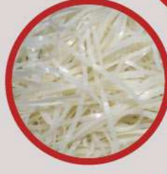
RICE STICK NOODLES เส้นเล็ก