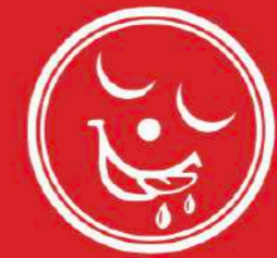
11 SHAVED ICE IN RED SYRUP AND SWEET CONDENSED MILK 50.-