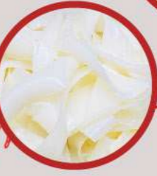
WIDE FLAT RICE NOODLES เส้นใหญ่