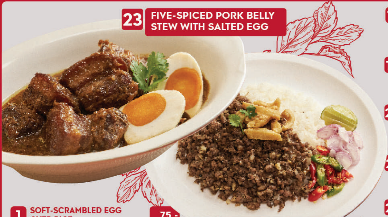
23 FIVE-SPICED PORK BELLY STEW WITH SALTED EGG