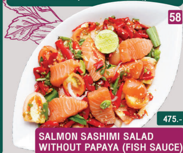
58 SALMON SASHIMI SALAD WITHOUT PAPAYA (FISH SAUCE) 475.-