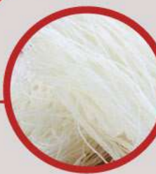
GLASS NOODLES วุ้นเส้น