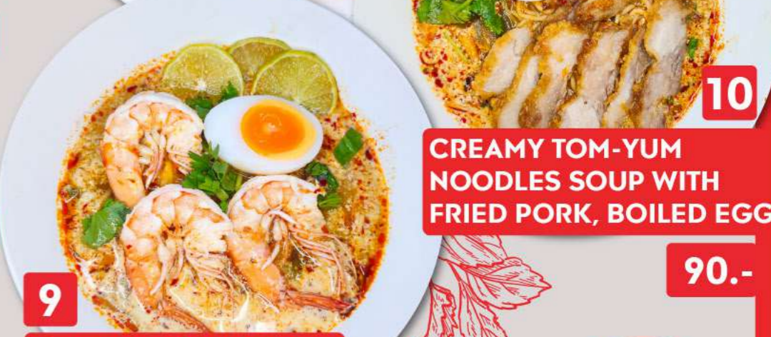
10 CREAMY TOM-YUM NOODLES SOUP WITH FRIED PORK, BOILED EGG 90.-